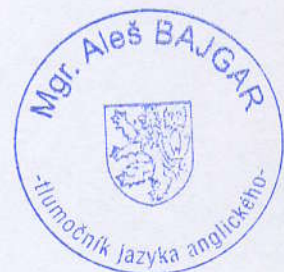
Mgr. Aleš BAJGAR soudní tlumočník jazyka anglického

Tlumočnický výkon je zapsán pod poř. č. 5962 deníku.