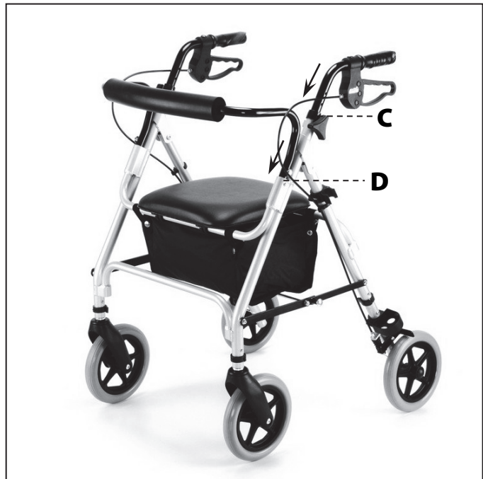
Madla zasuněte do otvorů C, opěrku zad do otvorů D.