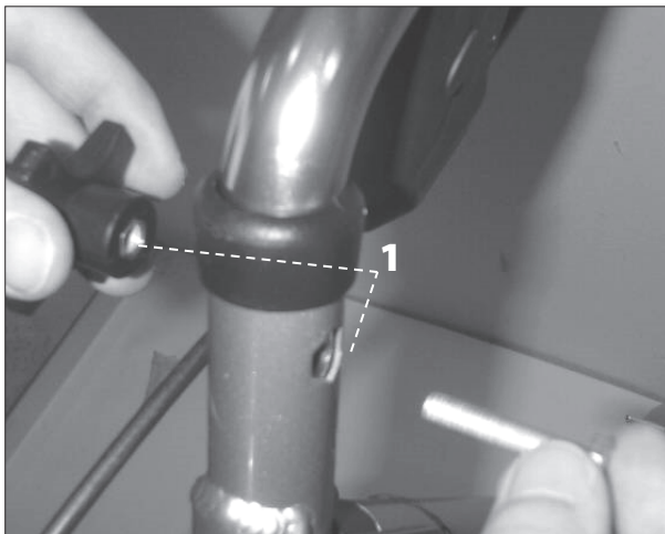
Madla upevněte pomocí šroubu a matice.