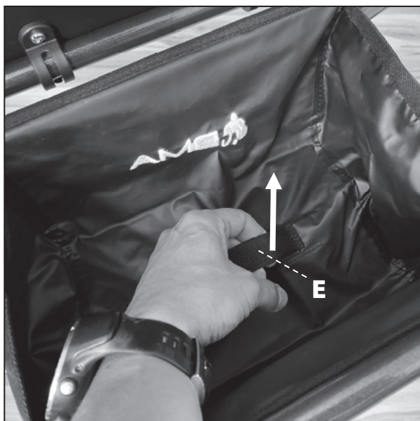
Madlo uvnitř tašky