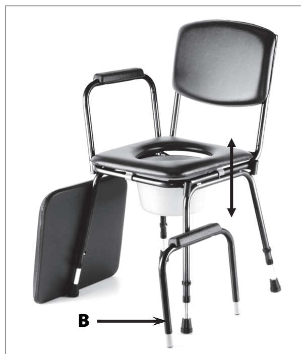
Vysunutí područky (513 S)