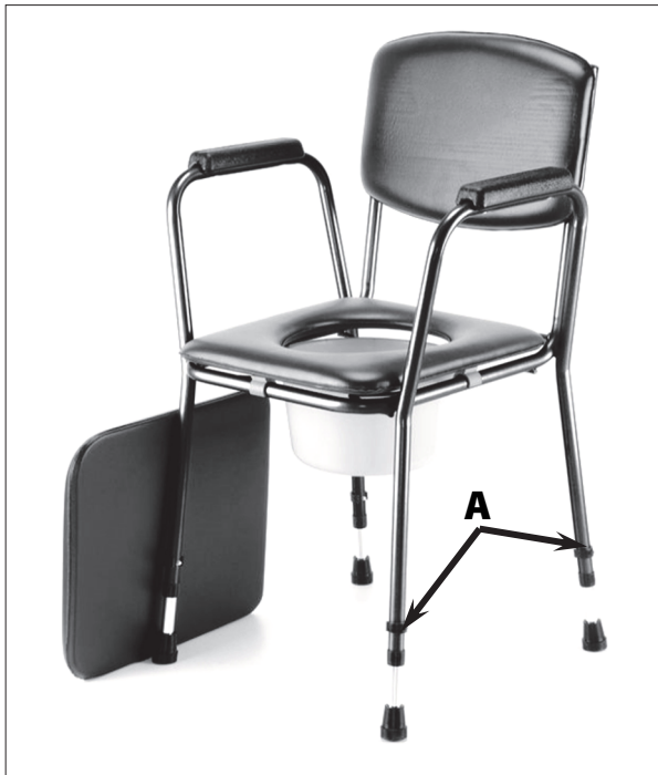
Umístění aretačních pojistek

Pro nastavení výšky křesla vyjměte aretační „E“ pojistku (A) a tahem/tlakem nastavte požadovanou délku nohy. Ve zvolené poloze pojistku zasuňte zpět. Tento postup opakujte u všech čtyř nohou.