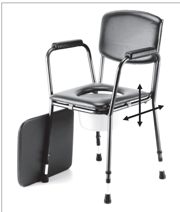
Vysunutí/zasunutí plastové nádoby

Pro použití křesla sundejte polstrovaný sedák a odstraňte víko plastové nádoby. Nádobu pak lze vysunout z držáků pod hygienickým prkénkem dozadu nebo vyjmout po odklopení prkénka horem. U modelu 513 S lze po zmáčknutí pojistky (B) tahem nahoru velmi jednoduše vysunout područku pro lepší nasedání.