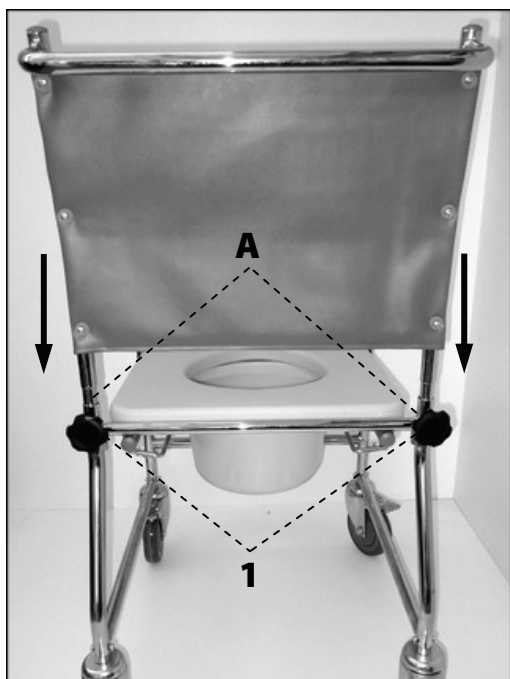
Nasazení opěrky zad

Vyjměte z krabice rám křesla s kolečky. Zasuňte spodní část opěradla do otvorů v rámu (A) a dotáhněte šrouby (1). Nasadte područky na úchyty na přední části křesla (B) a zacvakněte pojistkou (2). Madla vyndáte uvolněním této pojistky. Nasadte podnožky na úchyty umístěné na bocích křesla (C) a otočte směrem dovnitř, dokud nezapadne bezpečnostní pojistka (3). Podnožky odklopíte uvolněním této pojistky. Pro nastavení výšky stupačky povolte a opět utáhněte šroub (4). Na rám umístěte plastové hygienické prkénko a na něj položte polstrované sedátko. Zezadu vložte do držáků plastovou toaletní nádobu. Nyní je křeslo připraveno k použití.