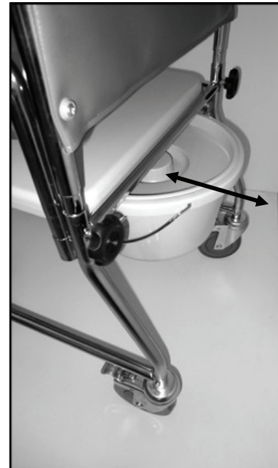
Manipulace s hygienickou nádobou