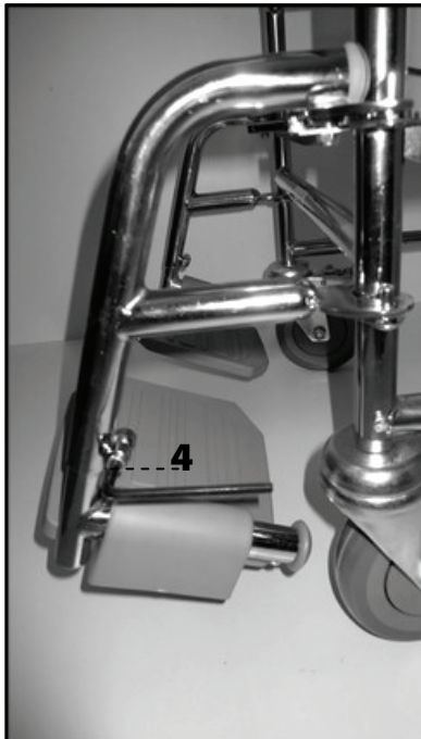
Nastavení výšky stupačky