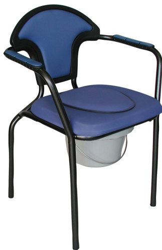
Open Ocean pevná

Návod k použití toaletní židle OPEN OCEAN