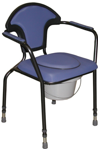
Open Ocean nastavitelná